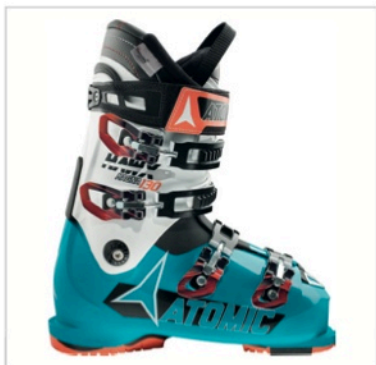
Caption: Atomic Hawx Magna 130 File: AE5013880_HAWX_MAGNA_130

È possibile utilizzare le foto gratuitamente per articoli stampa (solo PRINT MEDIA) facendo riferimento a Atomic e segnalando le informazioni riportate sul copyright. Altre immagini sono presenti all'interno dell'Atomic Brand Center: www.atomicbrandcenter.com