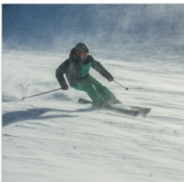
Caption: Atomic Hawx Magna File: DSC_3246_CMYK