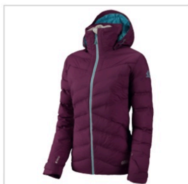
Caption: Atomic Treeline Hybrid Down Jacket W Berry 1 File: AP5015610_TREELINE_HYBRID_DOWN_JACKET_W_BERRY_1