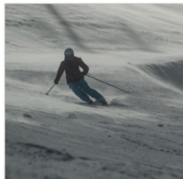
Caption: Atomic Hawx Magna File: AA7Z2453_CMYK