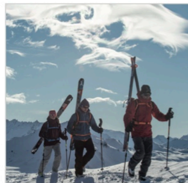
Caption: Atomic Backland File: GarrettGrove_NewZealand_4587