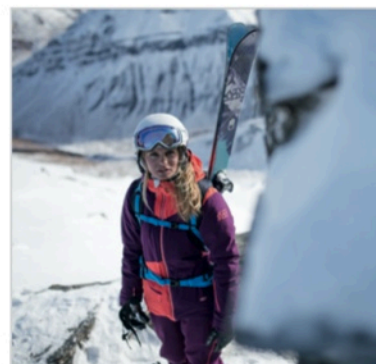
Caption: Atomic Vantage File: DSC_4209_CMYK