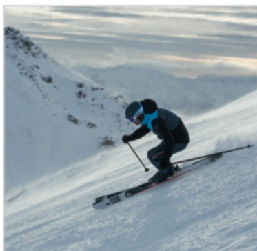
Caption: Atomic Vantage File: DSC_5333_CMYK