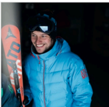
Caption: Atomic Redster XT File: DSC_4699_CMYK