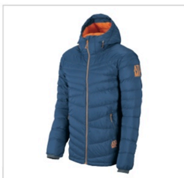
Caption: Atomic Ridgeline Hybrid Down Insulator M File: AP5017240_RIDGELINE_HYBRID_DOWN_INSULATOR_M_SHADE_1