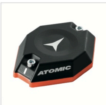
Caption: Atomic SkiTracer File: AL6000032001_SKITRACER