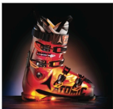
Caption: Atomic Hawx Memory Fit File: Glow_Hawx130_CMYK