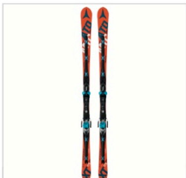
Caption: Atomic Redster Doubledeck 3.0 XT File: AA0025742_REDSTER_DOUBLEDECK_3.0_XT