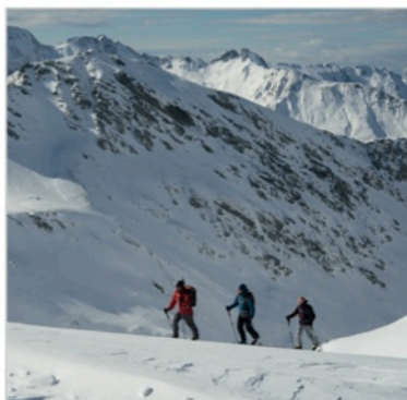
Caption: Atomic Backland File: GarrettGrove_NewZealand_3820_CMYK