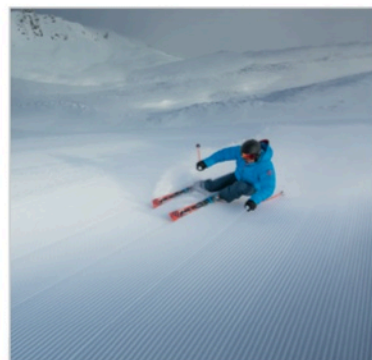
Caption: Atomic Redster XT File: DSC_5470_KeyVisual_CMYK