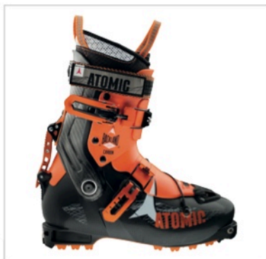
Caption: Atomic Backland Carbon File: AE5014060_BACKLAND_CARBON

È possibile utilizzare le foto gratuitamente per articoli stampa (solo PRINT MEDIA) facendo riferimento a Atomic e segnalando le informazioni riportate sul copyright. Altre immagini sono presenti all'interno dell'Atomic Brand Center: www.atomicbrandcenter.com