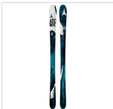
Caption: Atomic Vantage 90 CTI File: AA0025904_VANTAGE_90_CTI