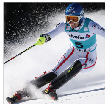
Didascalìa: Marlies Schild File: Schild_25111281010