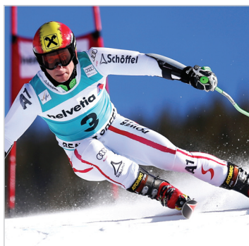
Didascalìa: Marcel Hirscher File: Hirscher_02121281059