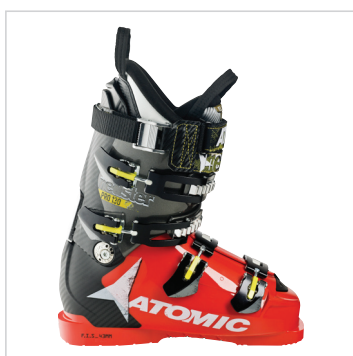
Didascalìa: Redster Pro 130 File: Redster_Pro_130_elements

È possibile utilizzare le foto gratuitamente per articoli stampa facendo riferimento a Atomic e segnalando le informazioni riportate sul copyright. Per altre immagini si prega di consultare l'Atomic Brand Center: www.atomicbrandcenter.com