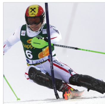
Didascalìa: Marcel Hirscher File: Hirscher_1111288002