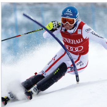
Didascalìa: Marlies Schild File: Schild_10111243154