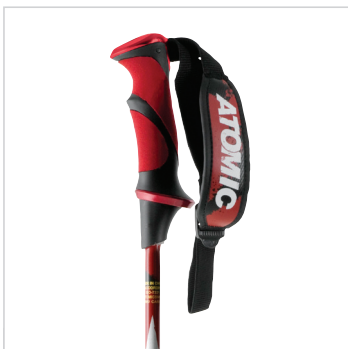
Didascalìa: Redster Carbon Composite File: AJ5001004_REDSTER_CARBO