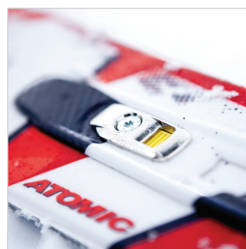
Didascalìa: Redster Doubledeck GS File: _N4G7380